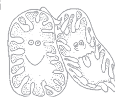
Disegno della dott.ssa Paola Costa

L'incontro si inserisce in un più ampio percorso di aggiornamento promosso dall'IRCCS "Burlo Garofolo", per la miglior cura possibile delle malattie rare.