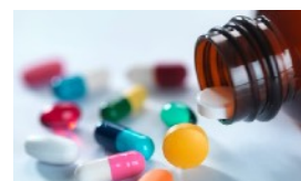
NUOVE TERAPIE PER L'HHT