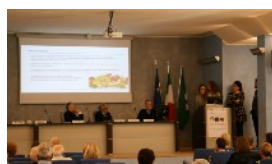
VI SPIEGHIAMO L'HHT

ore 8 registrazione partecipanti ore 13.15 conclusione